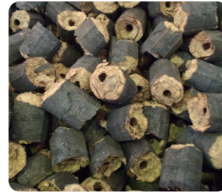
椰子ふさ( EFB )