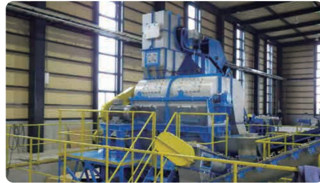
食品廃棄物リサイクル工場に設置 (MMS-800)