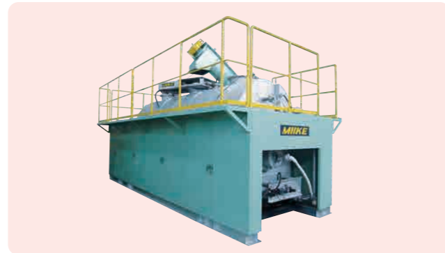
減圧加熱乾燥機 (MVCDシリーズ)

MIIKE では、自社オリジナルの機器で、企画・提案・設計・製造・据付・アフターサービスまで一貫して行うことができ、お客様の様々なご用途・ご要望にお応えいたします。また、 テスト用機械を完備しております ので、設備の見学および材料のお持ち込みによる実証テストもお受けいたしております。